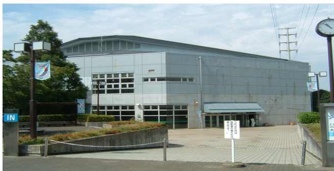
ならし の だい (習志野台7-5-1)