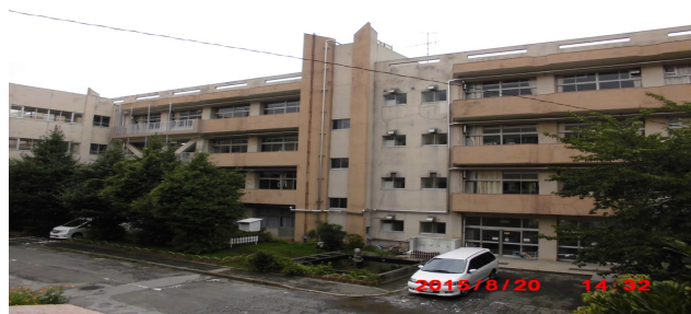
ならし の だい (習志野台5-43-1)