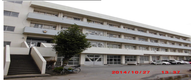
ななばやしちょう (七林町130)

たいいくかん かいしゅう ・ 体育館トイレを改修 しました。 ぎじゅつか じゅぎょう もち ・ 技術科の授業で用いる3Dプリンター はいび を配備 しました。