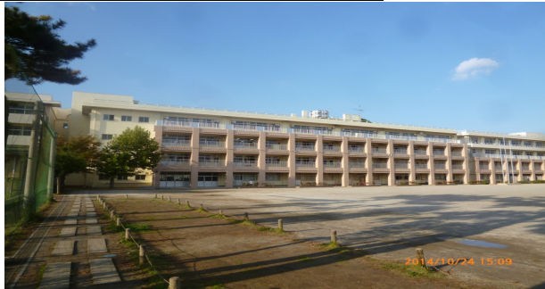
ならしのだい (習志野台6-23-1)