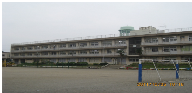
ならし の だい (習志野台2-51-1)

たいいくかん かいしゅうせつけい ・ 体育館バスケットゴールの改修設計を おこな 行いました。