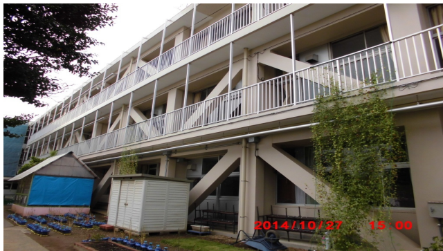
にしならしの (西習志野1-47-1)