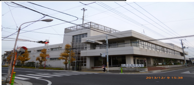
ならし の だい (習志野台5-1-1)

さいがいたいさくよう び ちくひん しょくりょう せい ・災害対策用の備蓄品として、 食料 や生 りようひん はいび ついか 理用品などの配備を追加しました。