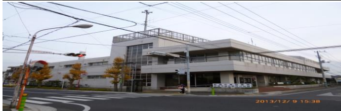
ならしのだい (習志野台5-1-1)