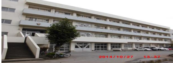
ななばやしちょう (七林 町 130)