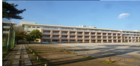
ならしのだい (習志野台6-23-1)