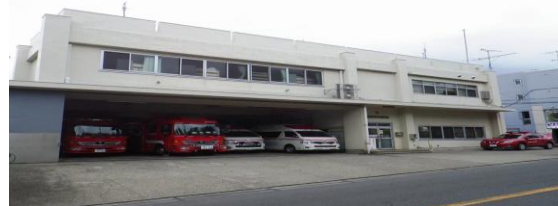
ならしのだい (習志野台3-18-23)