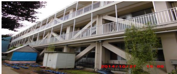
にしならし の (西習志野1-47-1)