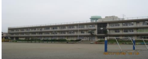
ならしのだい (習志野台2-51-1)

ならしのだいだいいちしょう ひだり だいにしょうがっこう みぎ 習志野台第一小 (左)・第二小学校 (右)