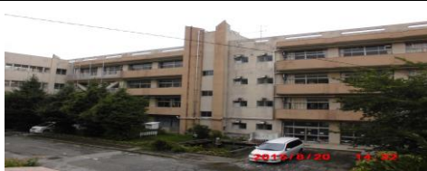
ならしのだい (習志野台5-43-1)