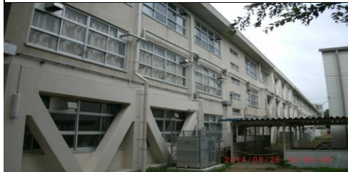
たかねだい (高根台5-2-1)