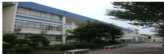
たかねだいちゅうがっこう 高根台中学校