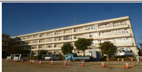
たかねだい (高根台1-4-1)