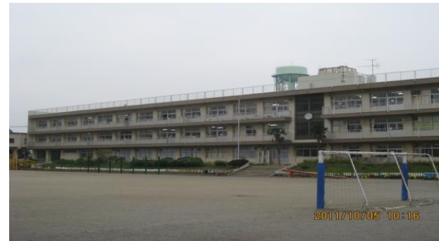
ならしのだい (習志野台2-51-1)

たいいくかん かいしゅうせつけい ・ 体育館バスケットゴールの改修設計を しました。