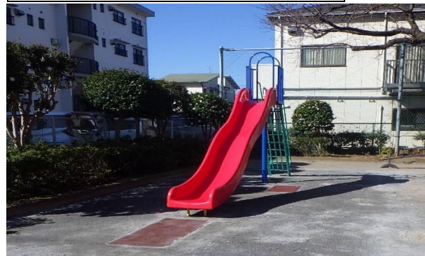
ならしのだい (習志野台1-7-1)