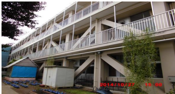
にしならしの (西習志野1-47-1)