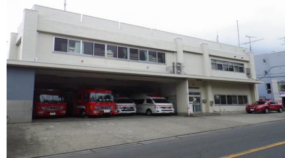
ならしのだい (習志野台3-18-23)