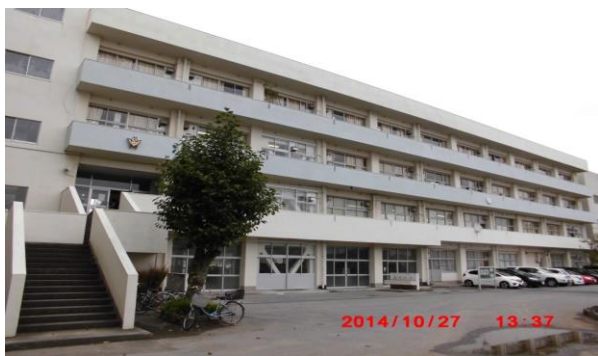
ななばやしちょう (七 林 町 130)