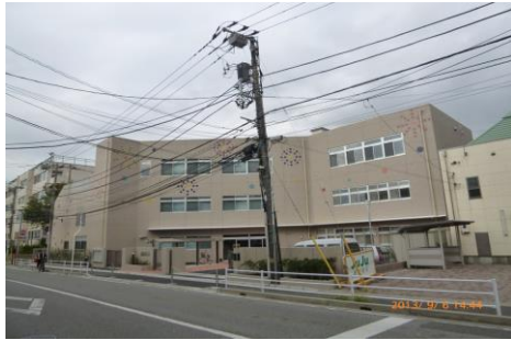
ならしのだいだい ひだり だい ほいくえん みぎ 習志野台第1 (左)・第2保育園 (右)